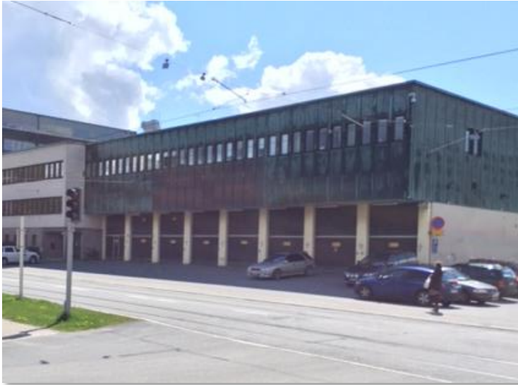
Fräsaren 9, Solna Business Park