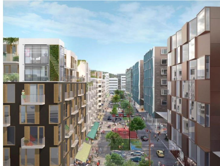
Haga Norra (Stora Frösunda 2, Hagalund 2:2)

Över tid ska alla delar bidra till verksamhetens totala resultat