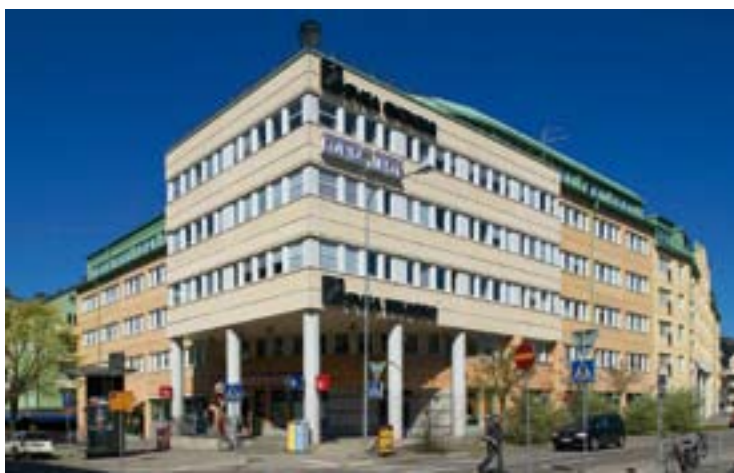
Planen 4, med 5 000 kvm uthyrningsbar yta i Solna, förvärvades i februari 2007.

Resultatet efter skatt uppgick för perioden januari-mars till 356 Mkr (180) och vinst per aktie efter utspädning till 3,72 kr (1,79). Hyresintäkterna var 517 Mkr