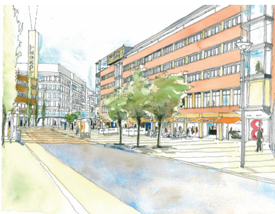
Helgafjäll 5 är ett kontorshus i Kista byggt 1978. Här planeras om- och nybyggnad samt uppfräschning av lokaler, butiker och torg.