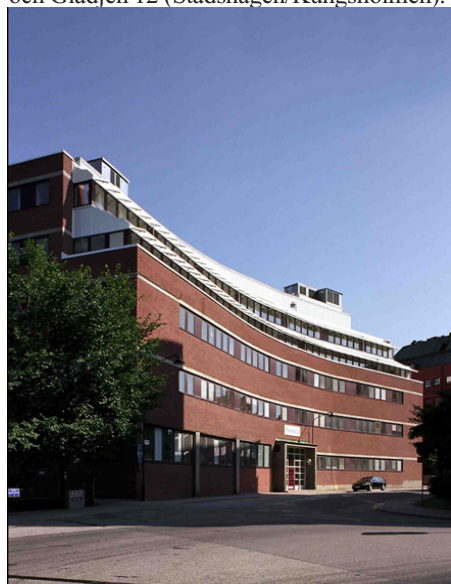
Om- och tillbyggnad av fastigheten Glädjen 12 på Kungsholmen som ska bli ett nytt huvudkontor för LRF.

Totalt 193 Mkr (258) investerades i befintliga fastigheter och projekt, och avsåg mark, ny-, till- och ombyggnader. De största investeringarna avsåg Bocken 39 (Norrmalm) och Glädjen 12 (Stadshagen/Kungsholmen).