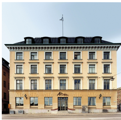
Fastigheten Aeolus 1 i Gamla Stan förvärvades i mitten av februari.

Hyresintäkterna minskade till 636 Mkr (859) och resultat efter skatt till 180 Mkr (278). Fastighetsbeståndet har genomgått betydande förändringar sedan första kvartalet 2005 1 vilket haft väsentlig effekt på intäkter och resultat. För jämförbart bestånd var hyresintäkterna i nivå med motsvarande